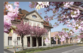
Theater Casino Zug

Schweizerische Gesellschaft für Orale Implantologie (SGI) Schweizerische Gesellschaft für Oralchirurgie und Stomatologie (SSOS) Schweizerische Gesellschaft für Parodontologie (SSP) Schweizerische Gesellschaft für Rekonstruktive Zahnmedizin (SSRD)