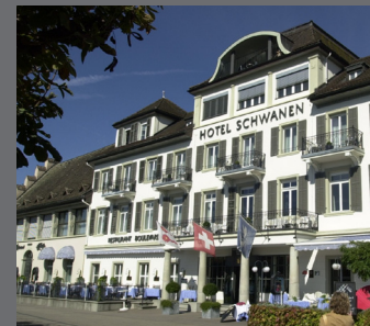
Hotel Schwanen, Seequai 1, Rapperswil

Schweizerische Gesellschaft für Orale Implantologie (SGI) Schweizerische Gesellschaft für Oralchirurgie und Stomatologie (SSOS) Schweizerische Gesellschaft für Parodontologie (SSP) Schweizerische Gesellschaft für Rekonstruktive Zahnmedizin (SSRD)